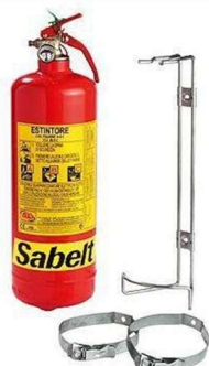
Exemple montage extincteur manuel