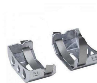
Exemple montage extincteur manuel ou automatique